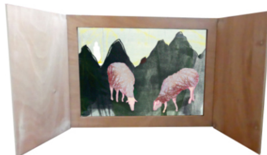
L'album jeunesse Du haut d'un phare , version kamishibai, 2023

Matériel : Butaï en bois. Panneaux de 70 x 50 cm (carton alvéolaire, contreplaqué, DISPA®...). Matériel de création plastique. Pour les ombres : une feuille de papier calque et une lumière. Du papier noir cartonné.