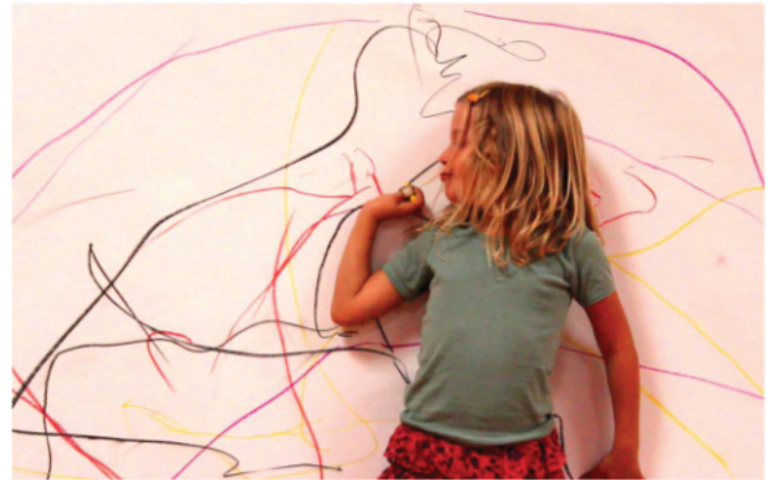
projet Segni Mossi pour la Fundacio Tapiés