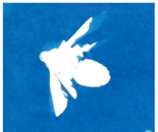
Le temps d'exposition influe sur le contraste et la transparence.